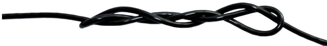
одна часть ремонтного узла

Далее необходимо полученный узел подтянуть, придав ему компактность.