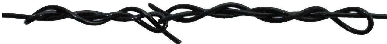
Соединения двух отрезков троса ремонтным узлом

3. Со вторым концом соединяемого троса делается тоже самое, с той лишь разницей, что конец троса продевается через петлю полученного узла. После чего делается аналогичный узел. Далее необходимо подтянуть узлы, что бы во время натяжки троса на шпалерном ряду они не дали ненужного удлинения.