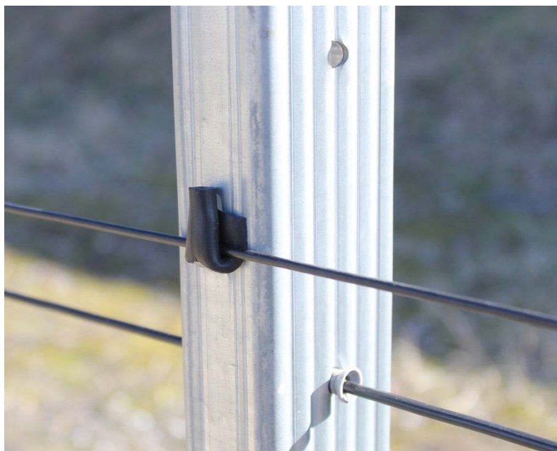
Шпалерный трос, закрепленный в проушине промежуточного столба

При возникновении необходимости соединить два отрезка троса, удлинить или заменить поврежденный участок троса, для этого применяется так называемый ремонтный узел. Данный ремонтный узел делается след образом: