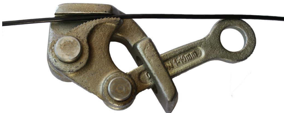
Тросовый захват для троса диаметром свыше 4мм.

Для натяжки тросов толщиной свыше 4мм. может использоваться самозажимный тросовый захват.