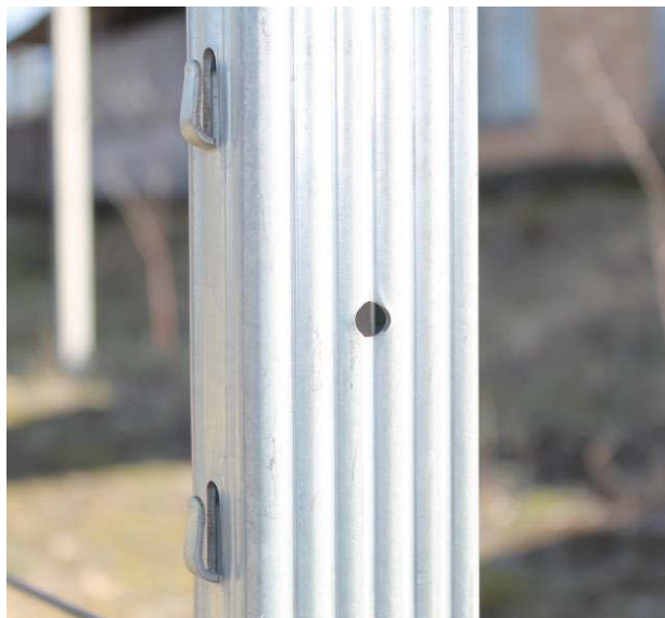
Виноградный шпалерный столб

Данные виды столбов изготовлены таким образом, что при монтаже шпалерного троса можно использовать два способа монтажа.