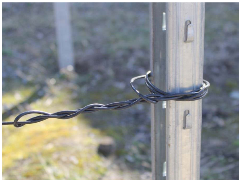
Крепление шпалерного троса к крайним столбам.

Закрепление троса на первом крайнем столбе при помощи узла «косичка» способом, описанным выше.