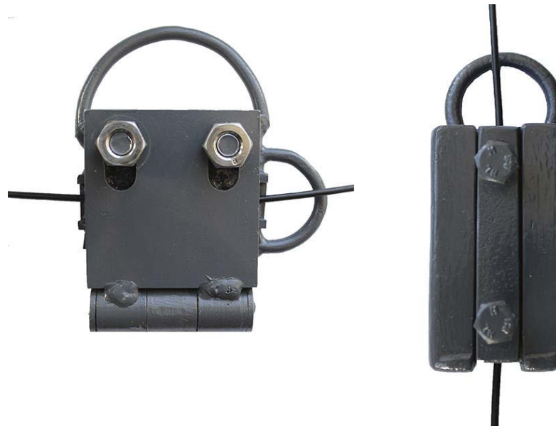
Тросовые захваты для троса 2-4мм.

Данные типы зажимов используются для натяжки шпалерных тросов от 2 до 4мм. В этих зажимах используются резиновые прокладки, которые не повреждают покрытие шпалерного троса во время сильной натяжки.