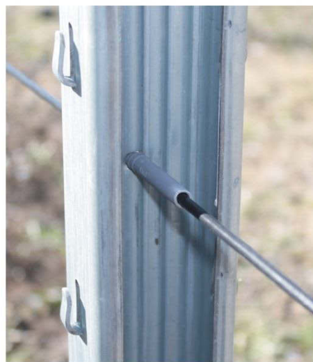
Установка троса через пластиковый дюбель

Закрепление троса на первом крайнем столбе при помощи узла «косичка» способом, описанным выше.