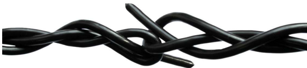
Место соединения двух отрезков троса