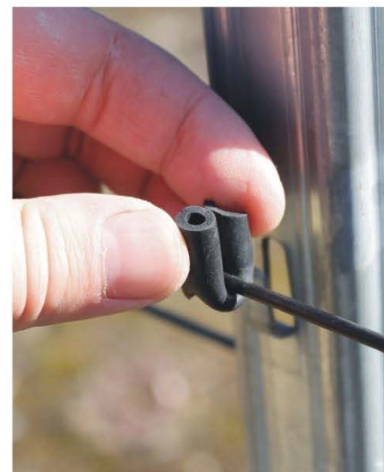
Установка защитного кембрика

Таким образом, после установки защитных кембриков, трос можно закрепить в проушине столба, обеспечив защищённость покрытия шпалерного троса.