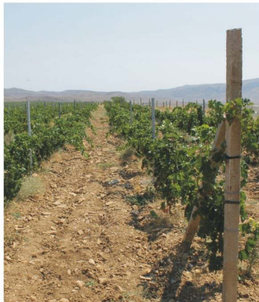
Металлические профилированные столбы

Благодаря гибкости шпалерного троса, его закрепление на крайних столбах осуществляется при помощи специального узла «косички». Такой тип крепежа обеспечивает быстрое, надежное крепление, не требующее никаких специальных средств и дополнительных затрат для фиксации шпалерного троса.