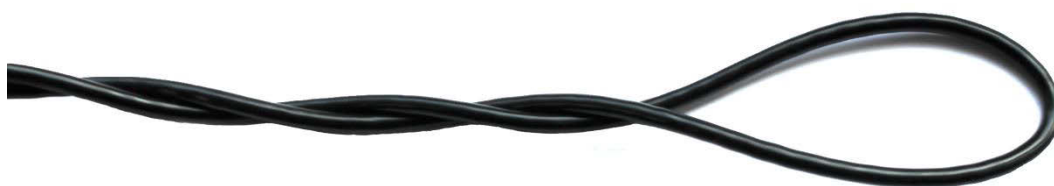
Косичка ремонтного узла одного из концов троса