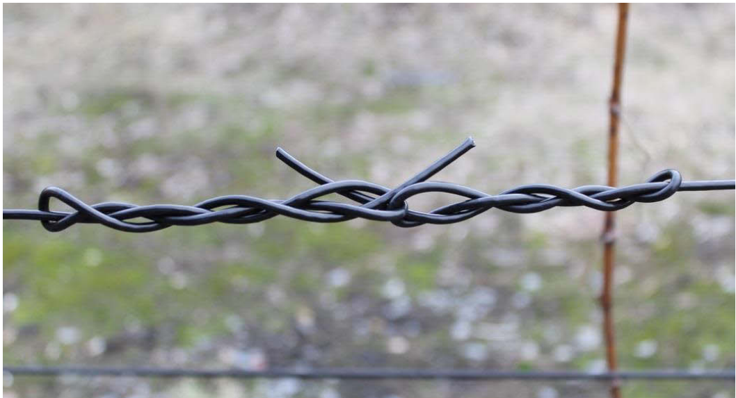
Ремонтный узел на шпалерном ряду

Не допускается использовать иные узлы, так как это приведет к повреждению полимерного покрытия!