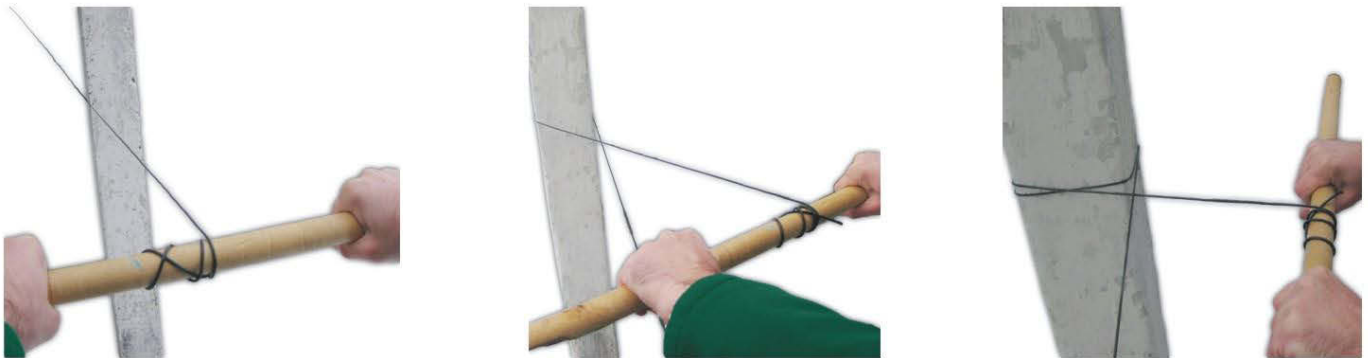
Натяжка троса вручную

Трос натягивается вручную до нужного усилия, после чего его оборачивают вокруг столба и, аналогично описанному выше способу, делается закрепление с помощью узла «косичка».